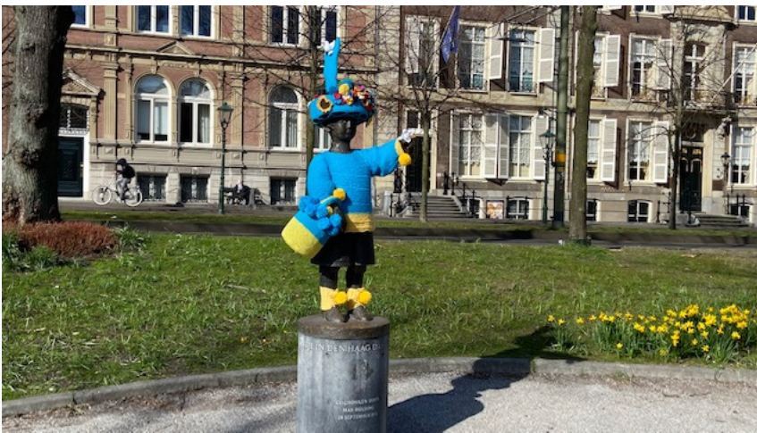
Haags Jantje in de kleuren van Oekraïne